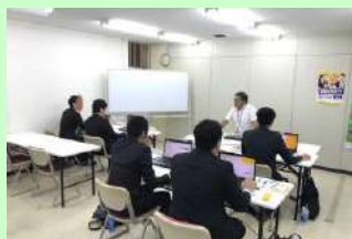
【中部会場】沖縄市上地2-20-5 2F