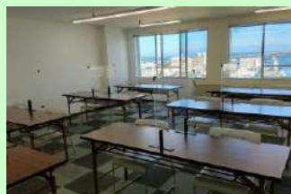
【那覇会場】那覇市前島 2-21-13 ふそうビルディング11F