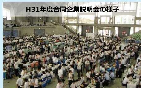
H31年度合同企業説明会の様子