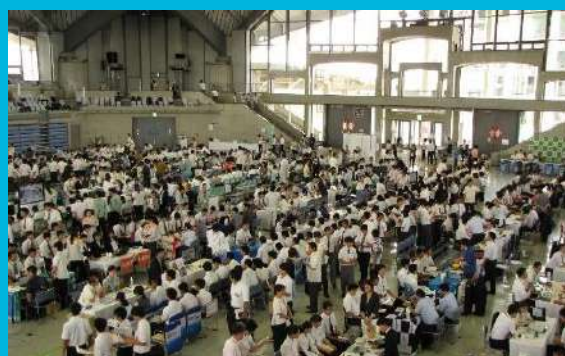
●H31年度新規高卒予定者 合同企業説明会の様子