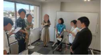
【那覇会場】那覇市前島 2-21-13 ふそうビルディング11F