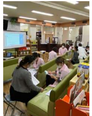
(研修風景) 理念研修

そこで、全店舗全スタッフに対して、同じカリキュラムで理念研修を行いました。店舗単位で育成の時間を取ることは大変ではありましたが、一緒に働く仲間がどんな思いで働き、何を大事にしているか、その人の背景を知る機会ができたことで、「自分の店舗の仲間が考えていることがわかってうれしかった」などの声が届いたことが一番良かったです。認証取得することで、「働きがい5分野15項目」ごとに改善点がわかり、社内で浸透していないところに注力して取り組んでいこうという意識が生まれました。育成する立場としても、そこを目指していけば、魅力のある会社・組織でいられると感じています。