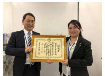
人材育成企業認証 認証書

その中で、一緒に働く仲間に対する優しさや、厳しさ、思いやりの気持ちも感じることができると思いますし、経験することは皆さんの成長の源になります。仕事を通しての成長を自分自身で実感し、未来の自分の成長予感を実現するために努力すると、逆境に立ち向かう力が身につく、自信に繋がるのではないのでしょうか。自分の力を信じて努力を惜しまない社会人になってほしいです。