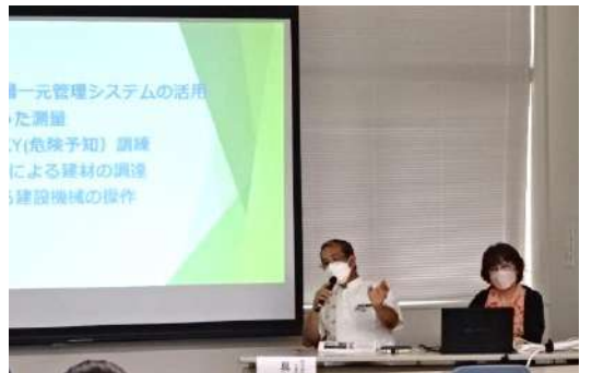
(写真はセミナーの様子)